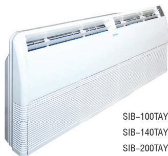
SIB-100TAV SIB-140TAV SIB-200TAV