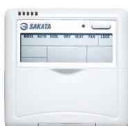
SAR-24 (опция + 10 м кабеля в комплекте)